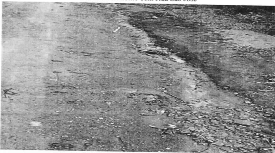
Rua Mario Albino com Rua São José