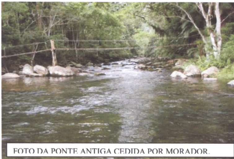
FOTO DA PONTE ANTIGA CEDIDA POR MORADOR.

Faz-se necessária a reconstrução da ponte de arame do Sertão do Taquari, pois a antiga foi levada pela enchente, e a atual foi construída em local inapropriado, uma vez que os moradores precisam andar por uma trilha por dentro da mata, além de ter que passar por dentro de propriedade particular, o que vem causando imensos transtornos aos mesmos.