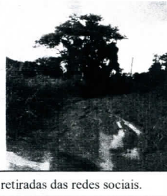
Imagens retiradas das redes sociais.