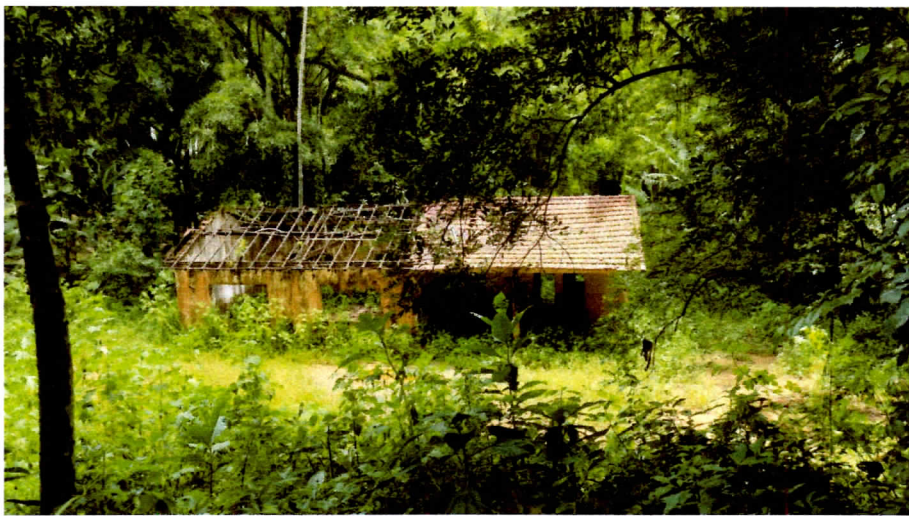
Prédio da antiga escola do Coriscão

Gabinete Professora Flora Câmara Municipal de Paraty - Paraty Patrimônio Mundial Rua: Dr. Samuel Costa, 23/25 – Centro Histórico – Paraty/RJ CEP: 23970-000 | Telefones: (24)3371-7513/(24)3371-1424